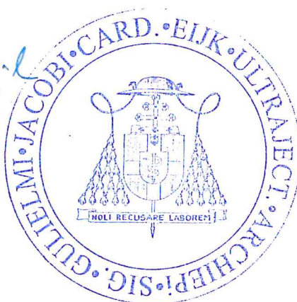
+ Willem Jacobus kardinaal Eijk Aartsbisschop van Utrecht