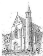
Parochie O.L.V. Onbevlekt Ontvangen Zenderen

Berichtgeving uit onze vergadering van 11 februari 2021